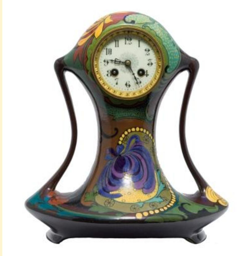
Purmerend model 82, decor R.